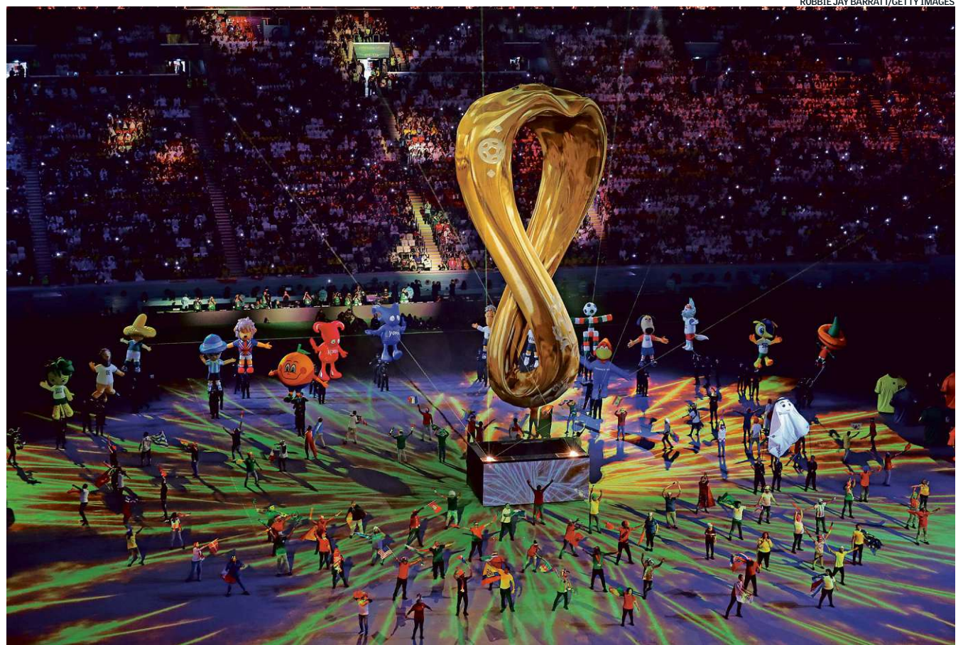
O logo gigante do torneio, em dourado, na abertura da Copa do Mundo 2022, no estádio Al Bayt: apelos em favor da diversidade e da inclusão

Com uma cerimônia de abertura marcada por apelos em favor da diversidade e inclusão e também pela primeira derrota de um país-sede no jogo de estreia, a Copa do Mundo começou ontem no Catar, no estádio Al Bayt, com a presença do emir do país, Tamim bin Hamad Al-Thani. A seleção da casa nunca havia disputado uma Copa e perdeu de dois a zero do Equador, com gols de Enner Valencia. A seleção brasileira ilustra o protagonismo da Inglaterra no futebol no século XXI. Dos 26 convocados por Tite, 12 atuam na Premier League, liga de clubes ingleses. Página B8