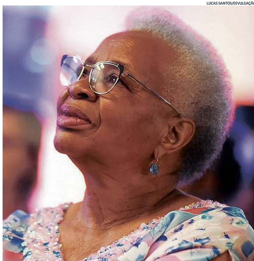
Graça: país estaria num caminho de mais prosperidade se houvesse menos desigualdade racial

Ativista dos direitos humanos e personalidade no combate ao racismo, a moçambicana Graça Machel diz que o Brasil poderia estar num caminho de mais prosperidade se mulheres e homens negros do país tivessem melhores oportunidades para produzir e empreender. O mesmo vale para as empresas. Um quadro de funcionários, executivos e conselheiros mais diverso produziria melhores resultados. "É preciso que isso seja trazido para o centro do desenvolvimento estratégico da empresa", afirmou ela ao Valor. "É dizer como, estruturalmente, a empresa vai criar essa diversidade, até nos níveis mais altos de decisão." Machel veio a São Paulo para encontros sobre superação do racismo que marcam o Dia da Consciência Negra. Página A2